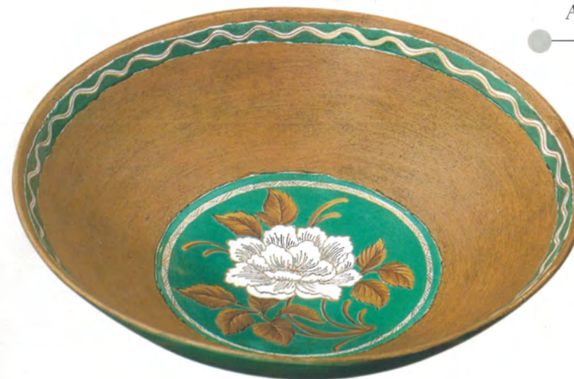
Coppa in cotto con decorazioni policrome in smalti di Anna Aloisa Mileto.